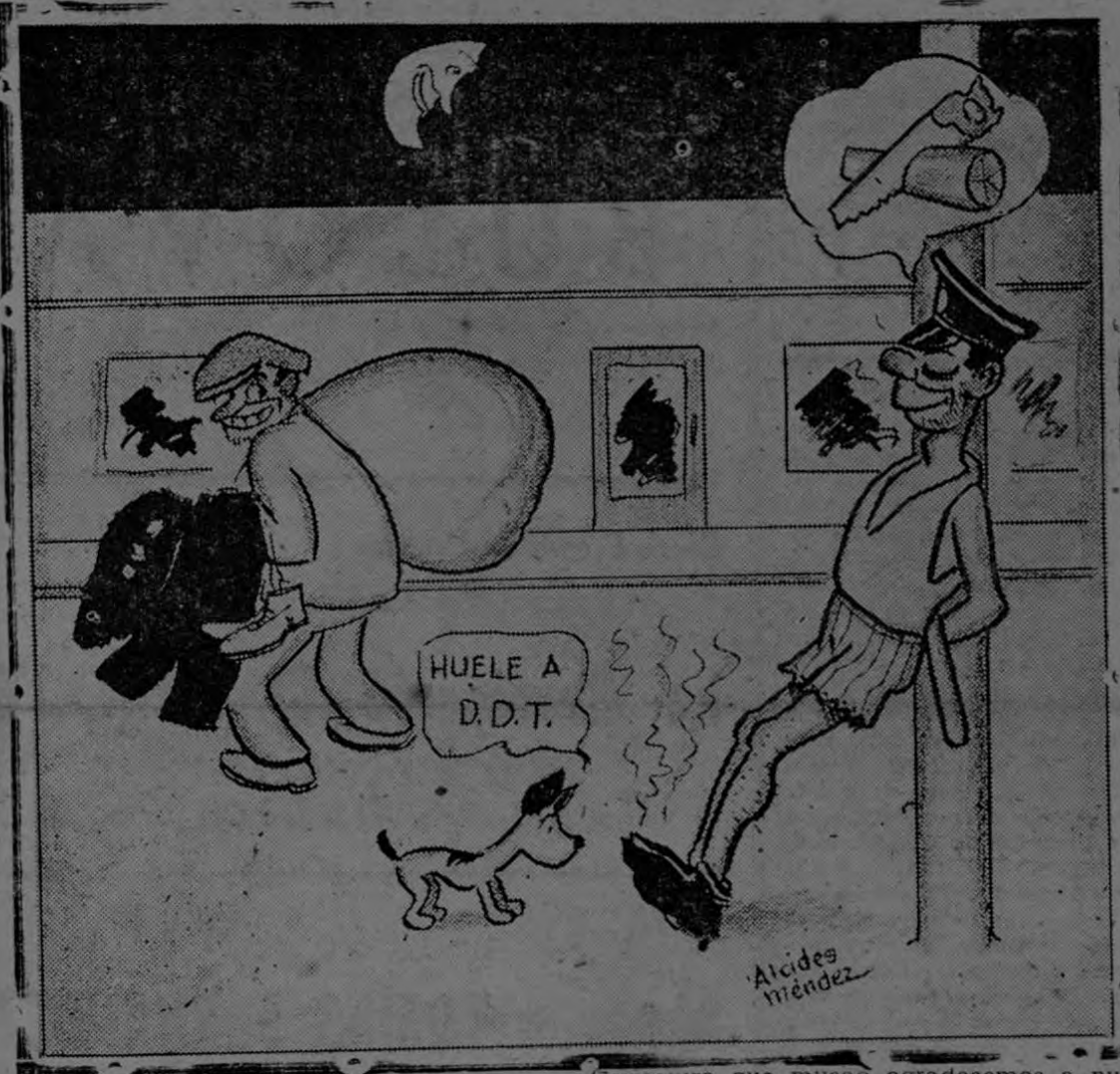
Caricatura que mucho agradecemos a nuestro colaborador artístico don Alcides Méndez

Al paso que vamos, con tanto riña, San José de Costa Rica brillará de primera en toda América. Y la policía de orden y seguridad?... No viejos, la policía está en espera de la portavianda mientras les safan los pantalones